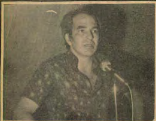
BRINCADEIRA DE MAU GOSTO