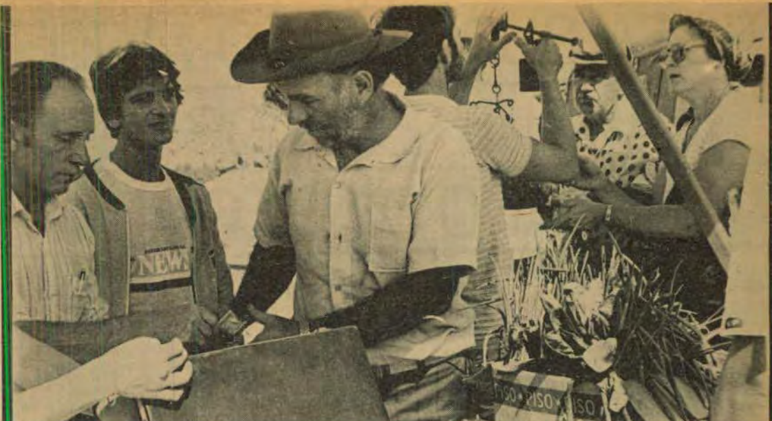
Feira do Pequeno Produtor: idealizada pela Secretaria Municipal de Agricultura

Rua Benjamin Constant, 116 - 1o. andar - salas 104/104 Fones: 74-1434 e 74-1682 - Foz do Iguaçu - Pr.