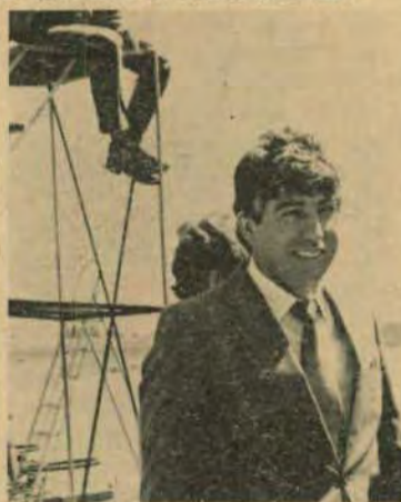
Darolt: perseguindo professores

que estão vendendo leite com data vencida. A forma para descobrir a mutreta é verificar se há nata pegada no plástico do "sachet" ou então se a data está visível ou não. Tem uma padaria que todos os dias pela manhã faz a operação "apaga data de vencimento". Passam álcool ou acetona e assim vão enganando os consumidores.