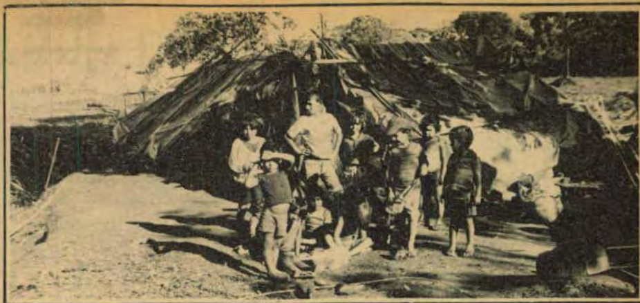
As crianças são as mais castigadas no acampamento em Cascavel.