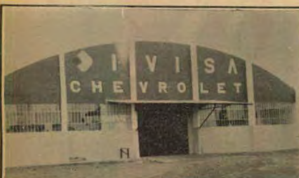
SEÇÃO DE AUTO-PEÇAS

Venda de reprodutores e jirinos de procedência americana. Em São Miguel do Iguçu, visite o nosso ranário no Pico Cuy - Fone: (0455) 65-1140. Em Toledo, fone (0452) 7376.