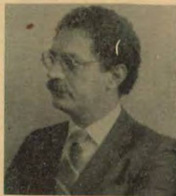
Mussi: não estamos fazendo vistas grossas