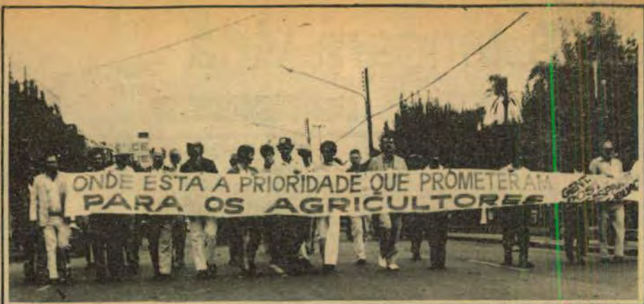
Agricultores sem terra prometem ampliar a luta