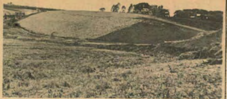
A barragem do lago artificial

O projeto elaborado pela Assessoria de Planejamento objetiva a preservação da flora nativa e sua reconstituição onde tiver sido devastada, a proteção de fundo de vale (na área existem as nascentes do Rio Cascavel), a fixação de um "pulmão verde" para a cidade e, finalmente, a destinação de uma ampla área de lazer. "Aliás, a falta de alter-