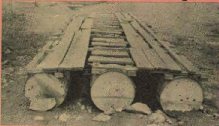
Nesta balsa os 'bandidos do lago' passavam carros roubados para o Paraguai.

Até o momento a polícia de São Miguel do Iguacu não tem maiores pistas para chegar até o assassino do sargento da PM Brás Emiliano Schorro de Oliveira. O policial foi assassinado no dia 12, às 9:30 quando acompanhava um tenente e dois soldados num trabalho de levantamento no Lago de Itaipu. Na região de Laranjal, encontraram um acampamento abandonado e um tiro partiu do matagal. O sargento foi atingido por um projétil de sete milímetros e faleceu em seguida.