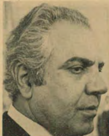
Richa: já expulsamos 500