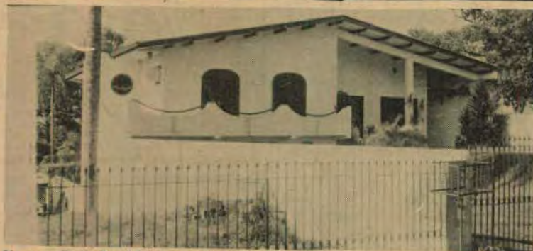
Na mansão de Perci Lima, horas de tensão e angústia

Ladrões encapuzados levaram quase 30 milhões