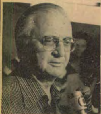
Cavalcanti: bagunçando a sucessão