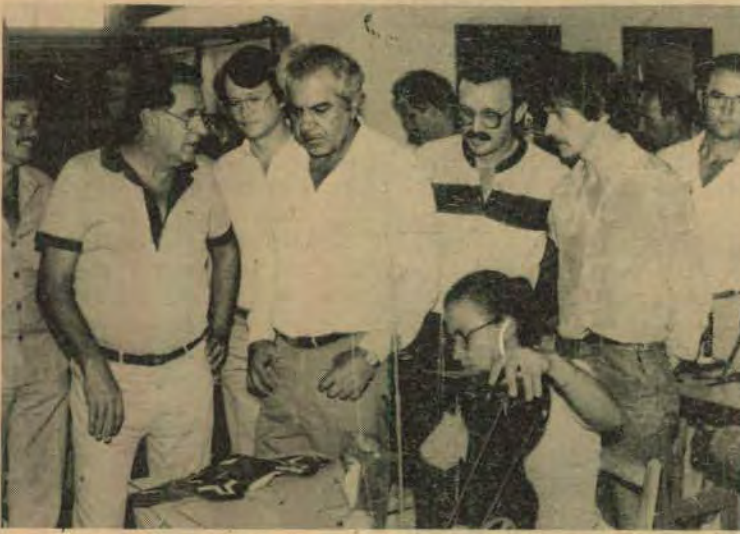
Richa visitou as indústrias comunitárias