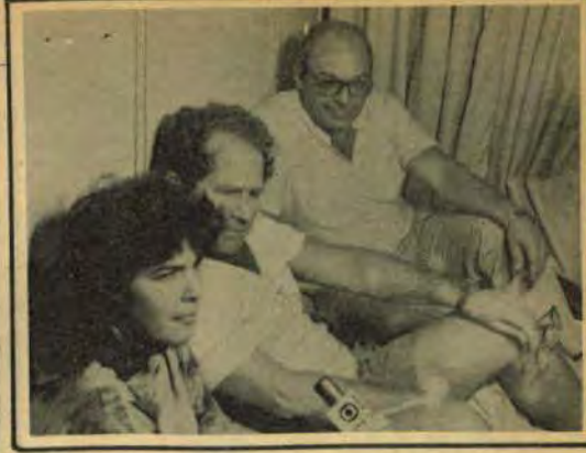
Os vereadores dividem seu tempo entre receber solidariedade de amigos, e concedendo entrevistas a repórteres