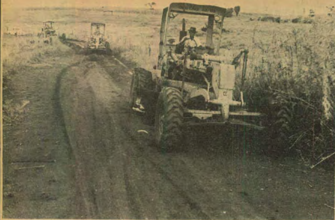
A Prefeitura de Cascavel concentra seus esforços no interior: a meta é garantir o escoamento das safras