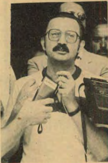
Corazza: preservando a memória do Município

Blocos carnavalescos interessados em participar do Carnaval