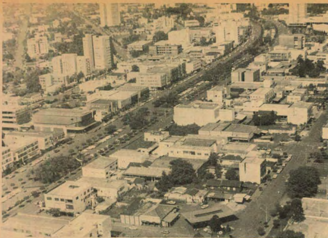
Cascavel: uma cidade com 130 mil habitantes sem rede de esgotos

Para este ano a COPEL considera que deverá ligar até 105.000 novos consumidores nessa área, uma vez que já tem assegurados os recursos financeiros e materiais necessários.