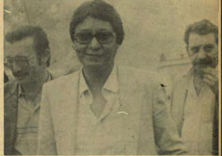
Fonseca: Medianeira precisava de um delegado de carreira...

NT - Quer dizer que o partido não deve se envolver diretamente?