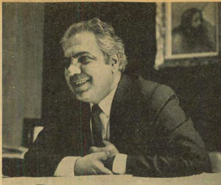
Richa: elogiado até pelo PDS

Quando você for fazer sua refeição, não esqueça que a rede Rafain tem o melhor serviço