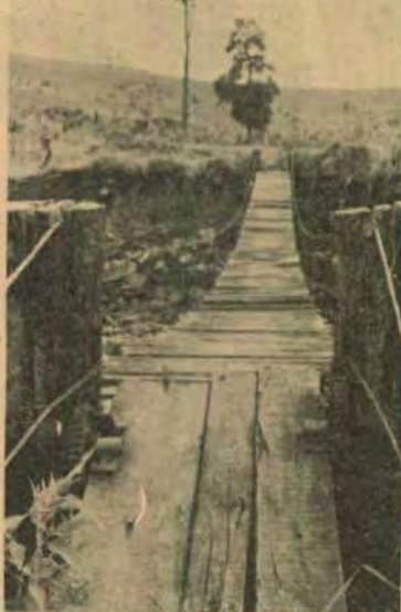
Pontilhão improvisado: será substituído

Trata-se de vias alargadas, cuidadosamente patroladas e cascalhadas, e dotadas de infraestrutura básica (pontes e buei-