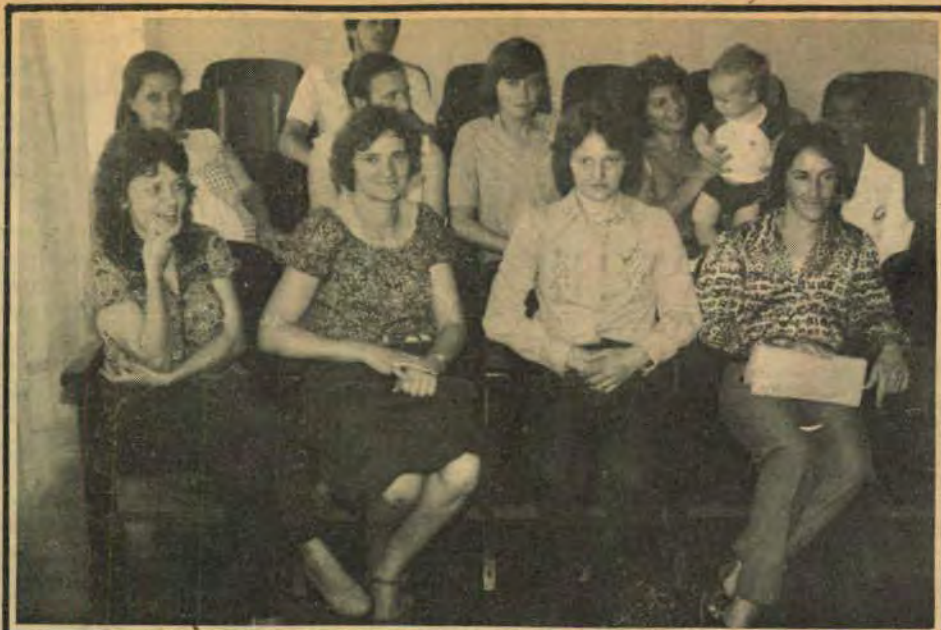
... E as professoras demitidas