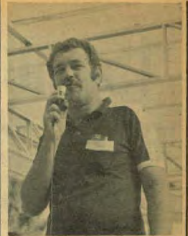
Kirinus: romper com o Uruguai