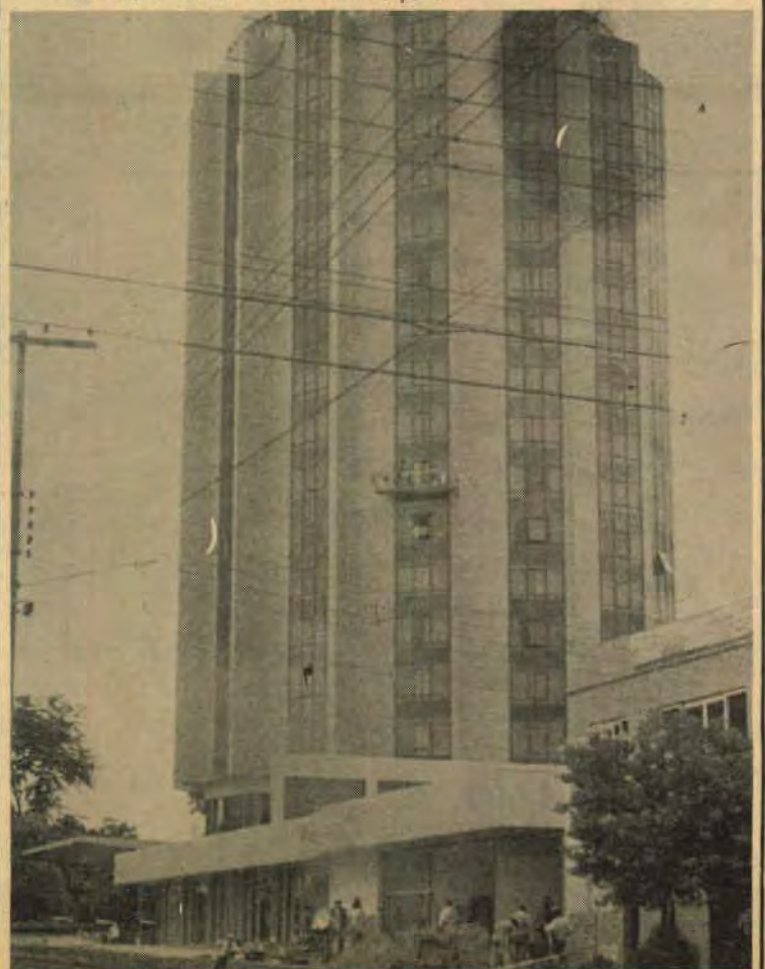
O Hotel Internacional abriu 160 vagas: 4000 candidatos se apresentaram.