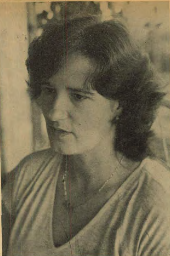
Prefeita Lenir Spada: exemplo para muitos prefeitos

O prazo de exercício na escola é de trinta dias a contar da data da posse. Se o interessado não puder entrar em exercício no prazo estabelecido, poderá também solicitar prorrogações de trinta dias.