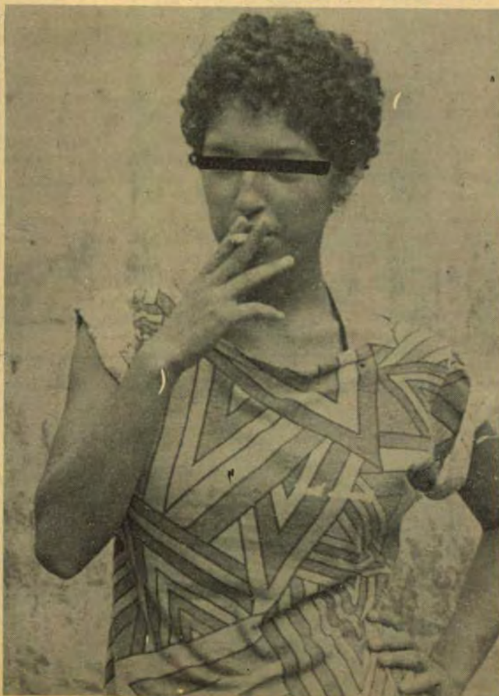
Reny, a ladra de jóias, está presa em Foz. Página 2