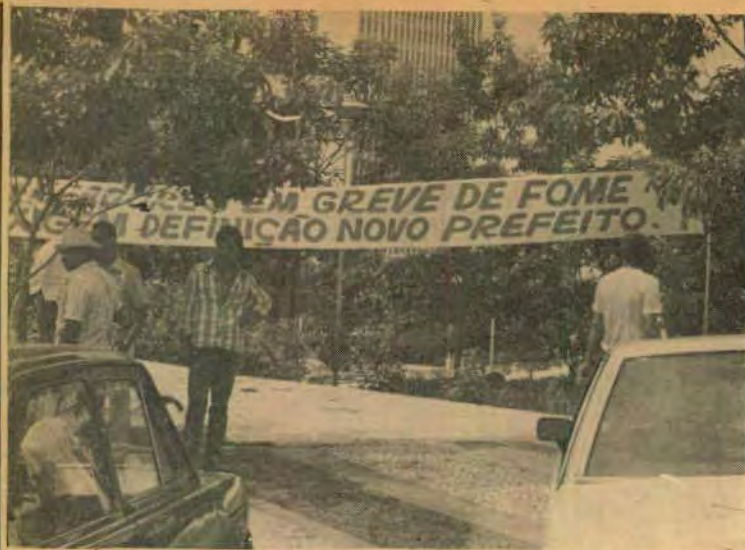
Em frente, à Câmara, faixas de protesto