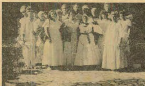
A homenagem que as mães e pais-de-santo prestaram aos vereadores foi um momento de grande emoção.