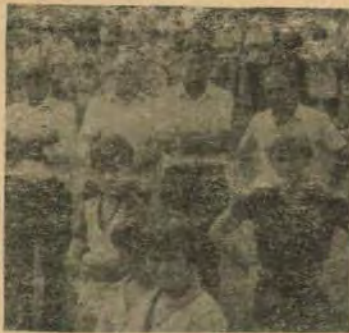
Autoridades prestigiaram o 1o. aniversário de emancipação.