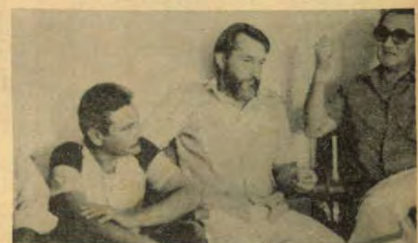
Vereadores de Puerto Iguazu (Argentina) também trouxeram a solidariedade aos grevistas iguaçuenses.