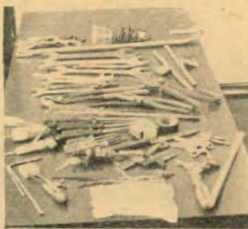
Os Cabriteiros usavam este arsenal de Ferramentas.

Justiça, que saía para a rua todas as vezes que havia algum roubo planejado. Entretanto no dia 2 a coisa zebrou tinha o carcereiro quanto o detento foram presos com a mão na