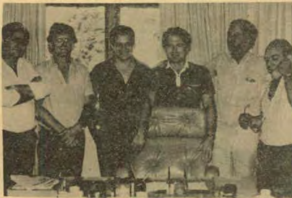
No início da greve a euforia....

Nas páginas seguintes várias pessoas ligadas à política falam sobre a greve de fome.