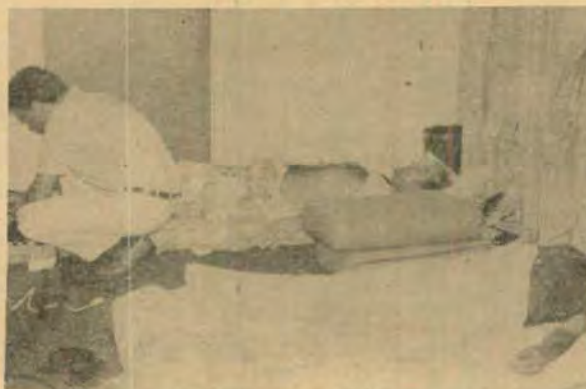
....depois a fome e o sono....