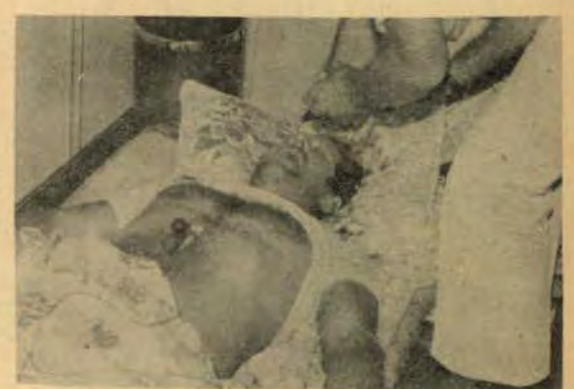
....e mais tarde o hospital.