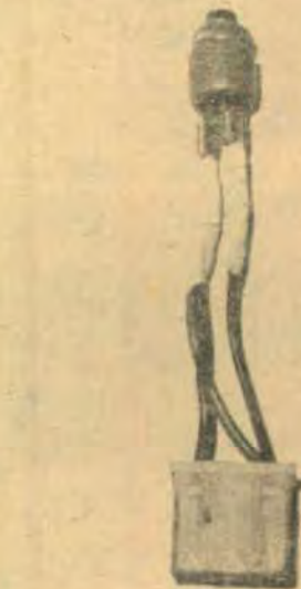
Interruptor de ignição usado pela quadrilha.