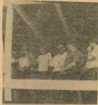
O povo festejou animadamente o aniversário.

Em seu pronunciamento Luciano Kreutz disse que a prefeitura investiu no primeiro ano em veículos e máquinas que fazem parte do patrimônio público. "Hoje vimos o desfile destas máquinas e veículos, mas não vimos móveis e utensílios. Não vimos ferramentas e objetos de trabalho e outros materiais permanentes. Não vimos desfilar os buiros que ao longo deste ano tiveram que ser construídos e reformados", afirmou Kreutz.