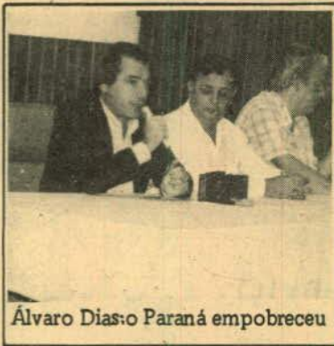
Álvaro Dias: o Paraná empobreceu

Ao retornar a Curitiba depois de participar de uma reunião com lideranças políticas do PMDB de Foz do Iguaçu, o senador Álvaro Dias, virtual candidato ao governo do Estado, despediu-se com uma certeza: o PMDB vai marchar unido nas eleições que se aproximam e o objetivo é conquistar o maior número de espaços políticos e administrativos.