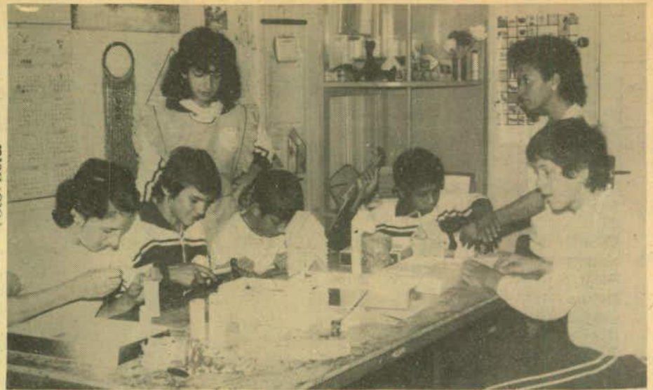
Professoras e alunos da Escola Melvin Jones