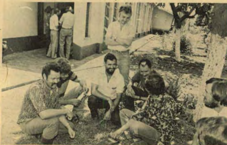
Agricultores fda Fazenda Cavernoso. Eles voltaram à terra deixando para trás da periferia.

A ocupação da Fazenda Cavernoso se deu de forma pacífica. As trinta e cinco famílias chegaram com seus trapos e ferramentas e já de cara levantaram os ranchos. Era a volta para o