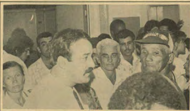
... e ocuparam a prefeitura