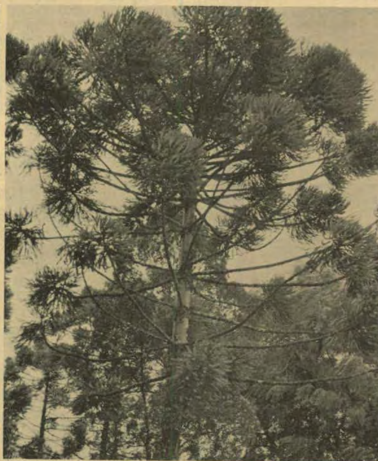
O parque visa preservar a flora nativa

dessa obra destacam-se a preservação da flora nativa e sua reconstrução onde tiver sido devastada a proteção de fundo de vale — já que na área existem vários cursos d'água, nascente do Rio Cascavel, — a preservação de um "pulmão verde" para a cidade e a destinação de uma ampla área para o lazer da comunidade.