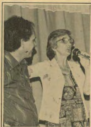
"Que Deus abençoe esta luta até a vitória final. Chega de explorações gente, vamos lutar contra o aumento das passagens" - uma moradora do Ouro Verde.