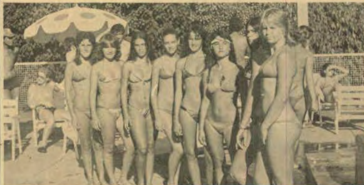
Candidatas do Clube Floresta