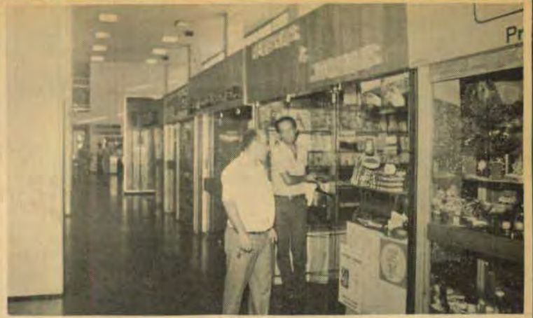
O livro está à venda em todas as bancas...