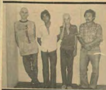
Eles iam vender o carro roubado para um milico do Paraguai.