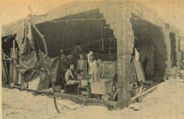
Sem terra e casa onde morar. Agora ameaçados de serem jogados na estrada

"Não fizeram até hoje a reforma agrária porque entra uns prá forcejar pelo povo e eles tiram dizendo que não presta.