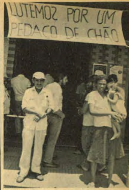
Eles esperam por justiça. Querem terra