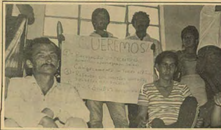
Os usuários fizeram a manifestação...

tado que todos iriam embora pacificamente e aguardar a decisão do Conselho. Alguns usuários mostravam-se bastante descontentes prometendo tomar "medidas mais drásticas", caso suas reivindicações não sejam atendidas.