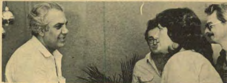
Incansável em sua luta por Santa Terezinha, a prefeita já anunciou que no próximo ano vai redobrar seus esforços.

- No PRODAP - Programa de Desenvolvimento do Artesanato Paranaense, discutiu sobre a possibilidade da Criação de uma Associação de Artesãos em sua cidade.