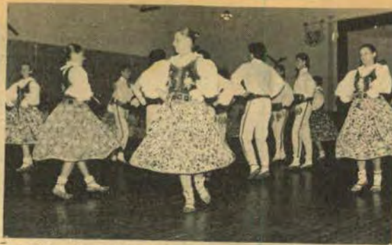
A diretoria da Escola São José reuniu pais e alunos no dia 26, quando foi apresentado o show do Grupo Folclórico Polonês do União Juventus, de Curitiba.