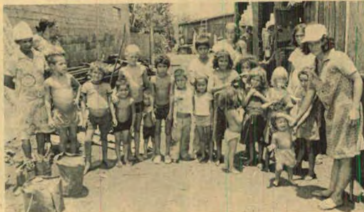
Mais de vinte e cinco crianças ameaçadas de irem para a rua.

Esperando a qualquer hora serem despejados as famílias de bóias-frias apelaram no dia 30 pedindo ajuda do governo estadual. Tiveram contatos com Antenor Bonfim (secretário de Assuntos Comunitários) e Nelson Friedrich (secretário do Interior). Estes se mostraram interessados pelo problema e prometeram uma solução razoável. Os ocupantes pedem lotes e madeira para construir ranchos.