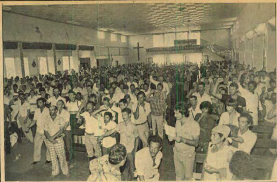
União e luta pela reforma agrária. agricultores sem terra na IV Assembléia do Mastro.