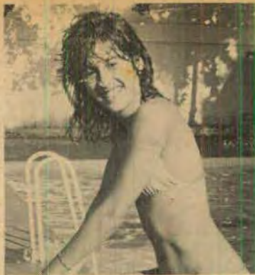
Targô Villa de Lima, representante do Country