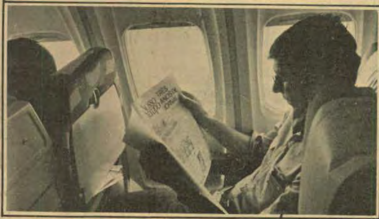
Jornal Nosso Tempo está agora à disposição de todos os passageiros da Transbrasil e Varig. Apertem os cintos e boa leitura.