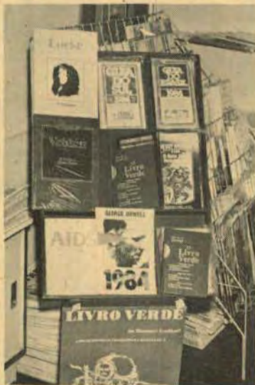
... inclusive na do Aeroporto de Foz do Iguaçu.

A distribuição do "Livro Verde" será feita inicialmente